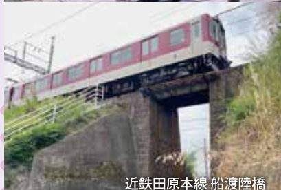
近鉄田原本線 船渡陸橋