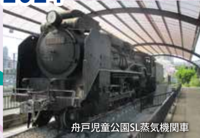
舟戸児童公園SL蒸気機関車

「素敵な賞品をご用意してお待ちしています」 鉄ロゲとは 地図を使い、チェックポイントを制限時間内に訪ね、多くの点数を集めるゲームです。鉄道やバスを利用することで、誰もが気軽に参加することが可能になりました。