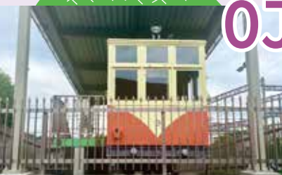
近鉄生駒線信貴山下「ケーブルカー」