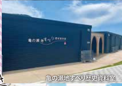
亀の瀬地すべり歴史資料室